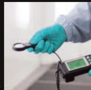
Lichtstärkemessung in der Lackierkabine